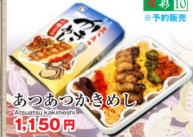
あつあつかきめし Atsuatsu kakimeshi 1,150円