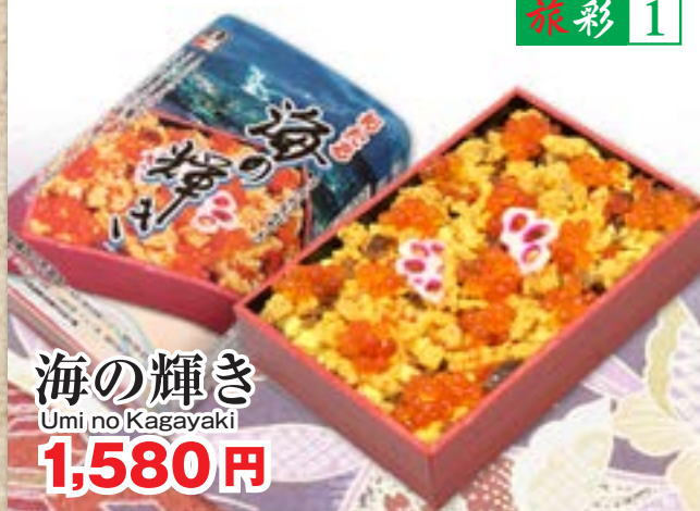
海の輝き Umi no Kagayaki 1,580円