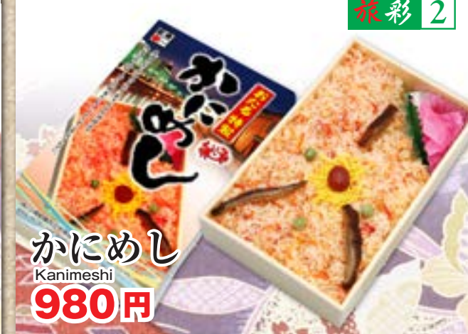
かにめし Kanimeshi 980円