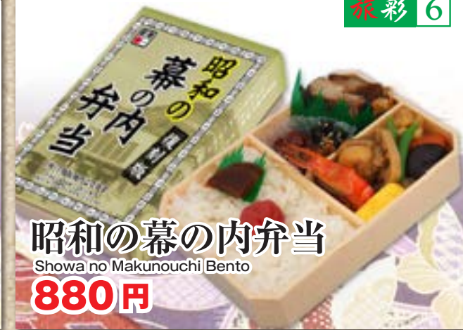
昭和の幕の内弁当 Showa no Makunouchi Bento 880円