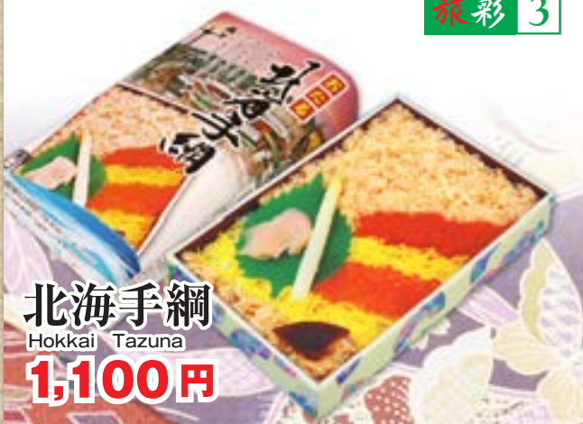
北海道手綱 Hokkai Tazuna 1,100円