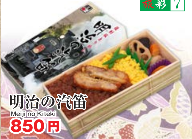
明治の汽笛 Meiji no Kiteki 850円