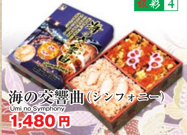
海の交響曲(シンフォニー) Umi no Symphony 1,480円