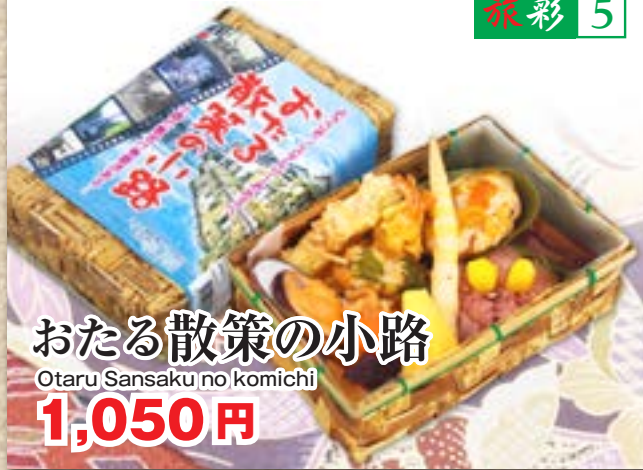
おたる散策の小路 Otaru Sansaku no komichi 1,050円