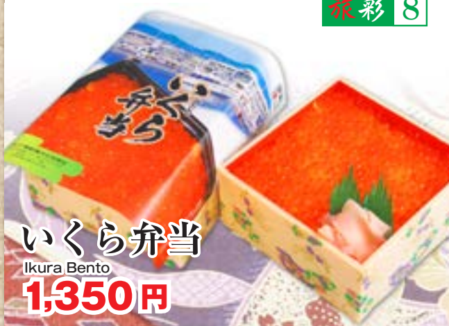
いくら弁当 Ikura Bento 1,350円