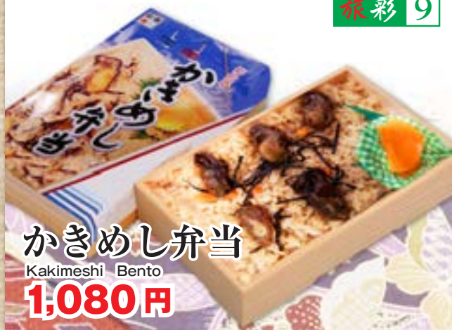
かきめし弁当 Kakimeshi Bento 1,080円